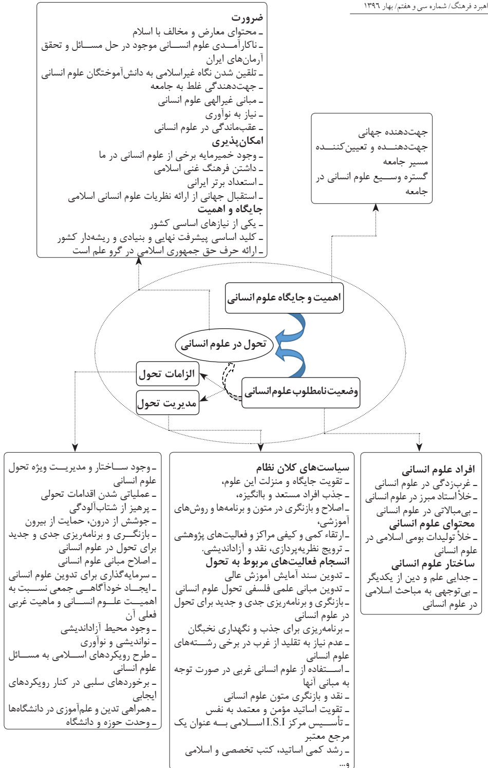
شکل ۱: مدل نهایی حاصل از مقوله‌ها و مفاهیم به‌دست آمده در پژوهش